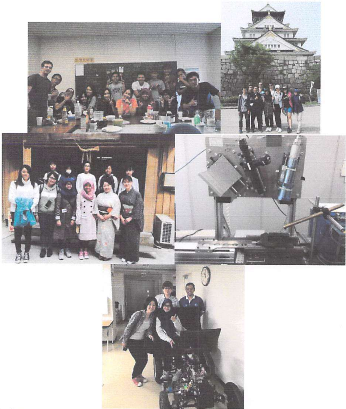
Gambar 1. Contoh-contoh kegiatan akademik dan non-akademik program student-exchange 4 bulan di Anan College Jepang.