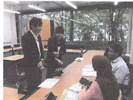
a. Kegiatan riset environmental modelling