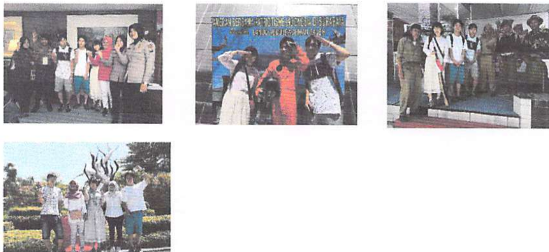
Gambar 5. Contoh kegiatan akademik dan non-akademik program student-exchange di PENS selama 1 bulan dari mahasiswa Anan College, Jepang.