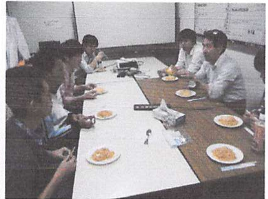
b. Kegiatan pertukaran budaya