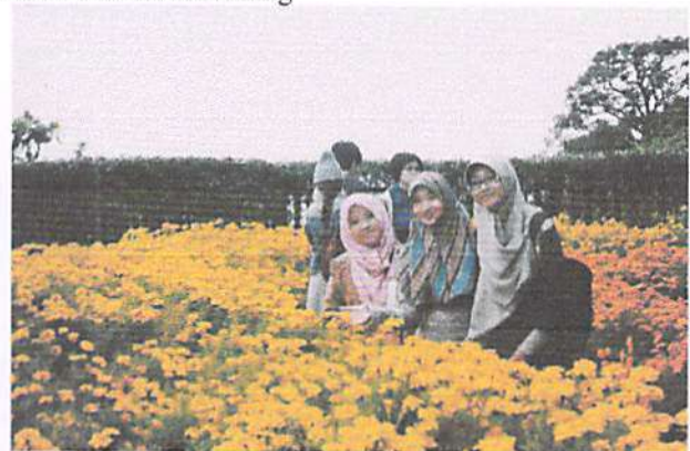
b. Kegiatan field trip dan pertukaran budaya