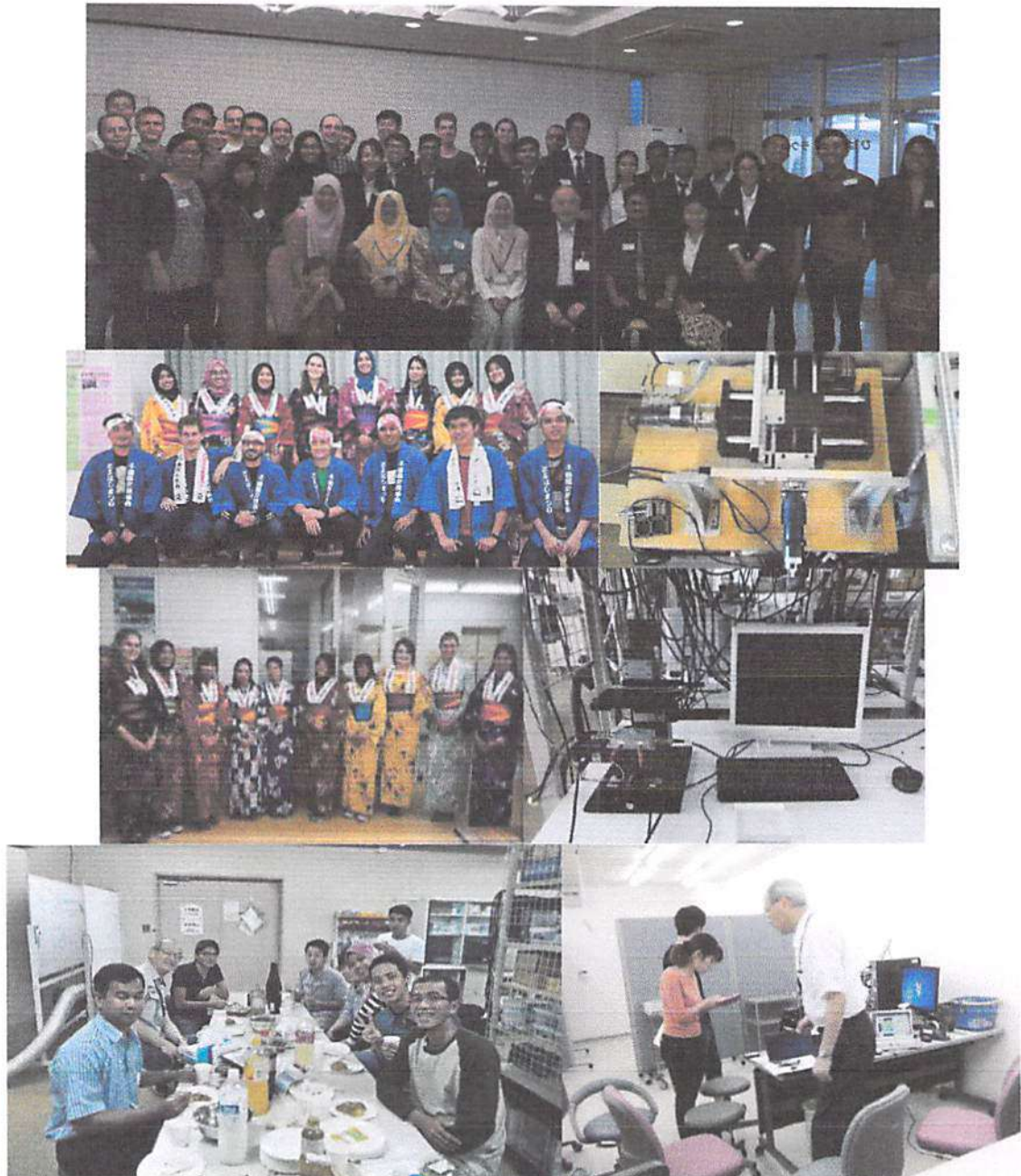
Gambar 2. Contoh kegiatan program student-exchange 1 bulan di Toyohashi University of Technology (TUT) Jepang.