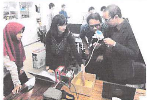
a. Kegiatan riset di Lab.